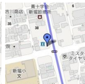
⑩ローソン新堀1丁目店