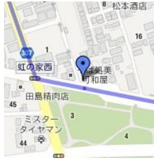
⑤西篠崎さくら公園