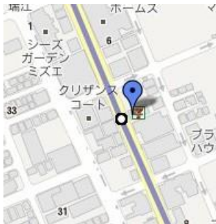
⑦セブンイレブン南篠崎4丁目店