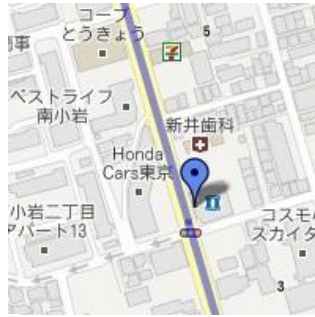
④ローソン東小岩1丁目店