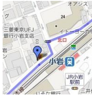
④小岩駅北口クリニック